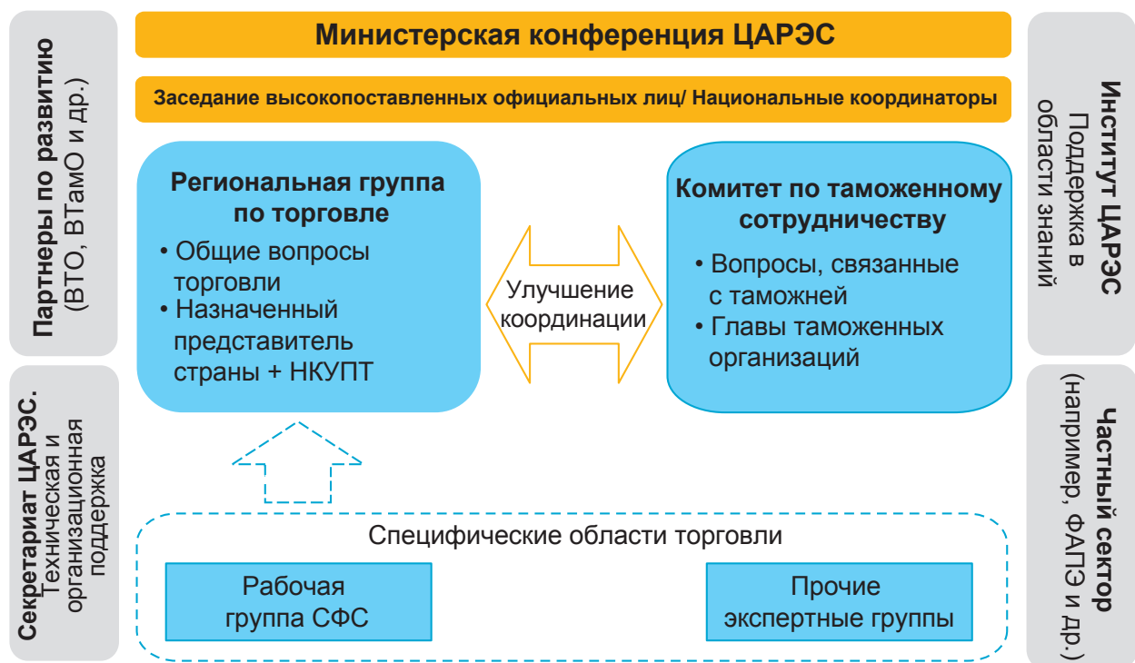
Иллюстрация А2а: Институциональная структура

ЦАРЭС – Центральноазиатское региональное экономическое сотрудничество, ФАПЭ – Федерация ассоциаций перевозчиков и экспедиторов ЦАРЭС, НКУПТ – Национальный комитет по упрощению процедур торговли, СФС – санитарные и фитосанитарные, ВТамО – Всемирная Таможенная Организация, ВТО – Всемирная Торговая Организация.