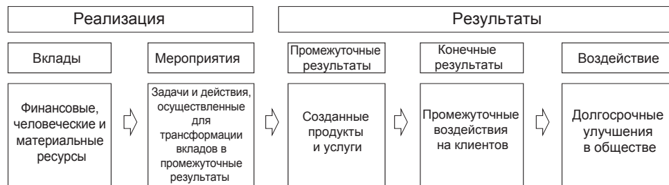
Рисунок А4.1: Цепочка результатов